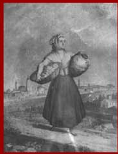
MARÍA AGUSTÍN (1784-1831)

Unas protagonizaron acciones de guerra llenas de riesgo. Otras realizaron tareas de apoyo a los combatientes y a la población civil en general, prestando atención humanitaria a enfermos y heridos y llevando armas y víveres a los frentes de lucha.