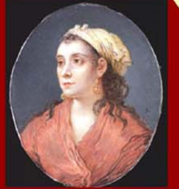
CONSUELO AZLOR DE VILLAVICENCIO, CONDESA DE BURETA (1775-1814)